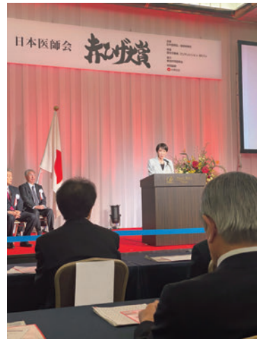
高市首相のご挨拶