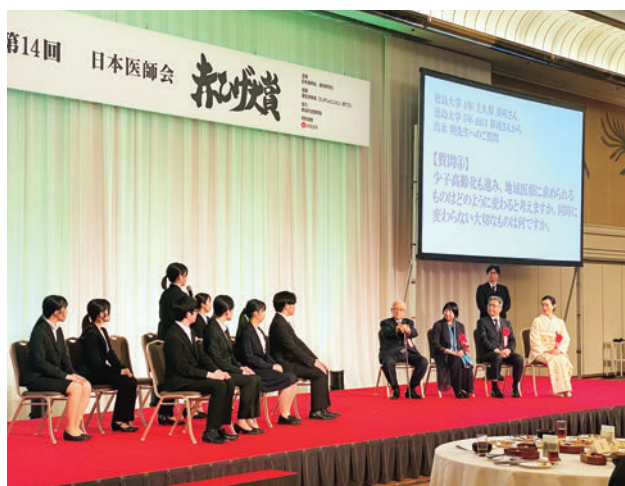
大賞受賞者と医学生の質疑応答