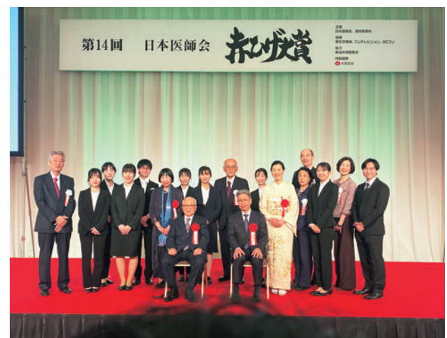
大賞受賞者を囲んで