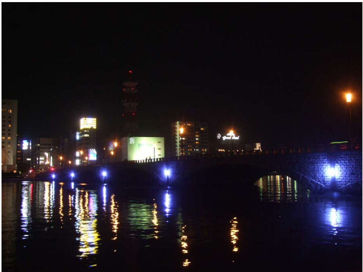
ライトアップ点灯の様子（平成22年11月14日撮影）